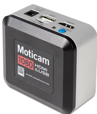
FOTO DEL PRODOTTO