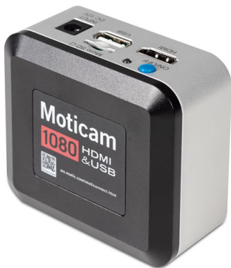
FOTO DEL PRODUCTO