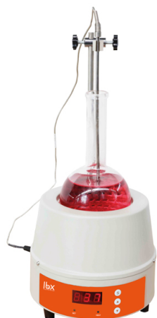
FOTO DEL PRODOTTO